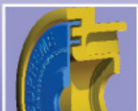
Glatter Rollenboden mit integrierten Labyrinth verhindert das Einklemmen von Fördergut