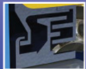
Mehrfach Labyrinthdichtung verhindert das Eindringen von Staub und Flüssigkeit

Die Melco « SUPREME » Tragrollen aus HDPE bieten Ihnen viele entscheidende Vorteile: