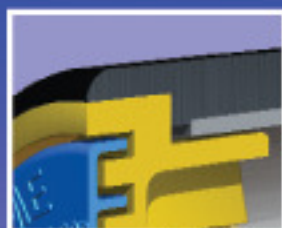
Dickwandige (12 mm) Ummantelung aus HDPE rost- und verschleißbeständig