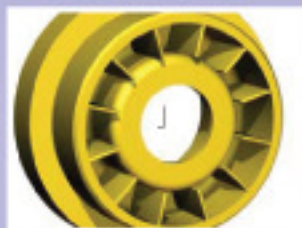
Sehr robustes Lagergehäuse aus Polymer